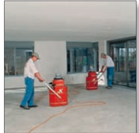
Met behulp van de gepatenteerde slijpmachine wordt een nauwkeurig sleuvenpatroon aangebracht.

Een ander voordeel van ingeslepen vloerverwarming: het is comfortabeler en efficiënter in gebruik. Omdat de verwarmingsbuizen direct onder de vloerafwerking liggen, is de temperatuur sneller en nauwkeuriger te regelen dan bij traditionele systemen. En dat scheelt natuurlijk weer in energiegebruik - en in uw portemonnee! Bovendien is het mogelijk om met zeer lage (35 - 45°C water) aanvoertemperaturen te werken, waardoor het uitstekend in combinatie met duurzame energiesystemen toegepast kan worden.