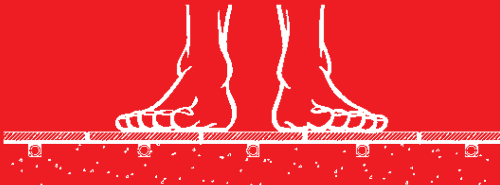
Verwarmingsbuizen direct onder de vloerafwerking voor een snelle opwarming en een nauwkeurige regeling.