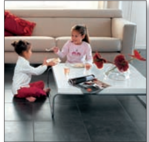
Vloerverwarming: de meest aangename warmte

HR-ketels halen bijvoorbeeld alleen hun hoge rendement als zij niet boven deze aanvoertemperatuur komen. Warmtepompen, zonneboilers en andere alternatieve warmte opwekkers zijn zelfs nauwelijks toe te passen als er temperaturen boven de 55°C nodig zijn en gaan bovendien beter presteren als de gewenste aanvoertemperatuur nog verder kan dalen. Aangezien dit soort verwarmingsinstallaties in de toekomst steeds meer toegepast zal gaan worden, zijn wij er van overtuigd dat vloerverwarming de toekomst heeft.