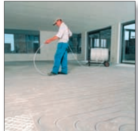
Het aanbrengen van de verwarmingsbuizen in de sleuven.